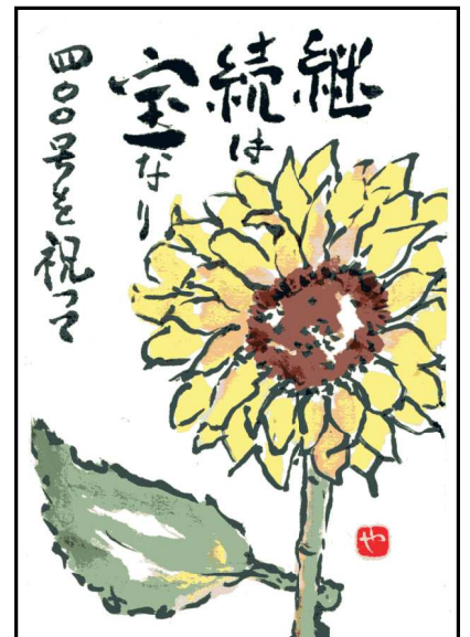
高 桂子田のKさんの絵手紙